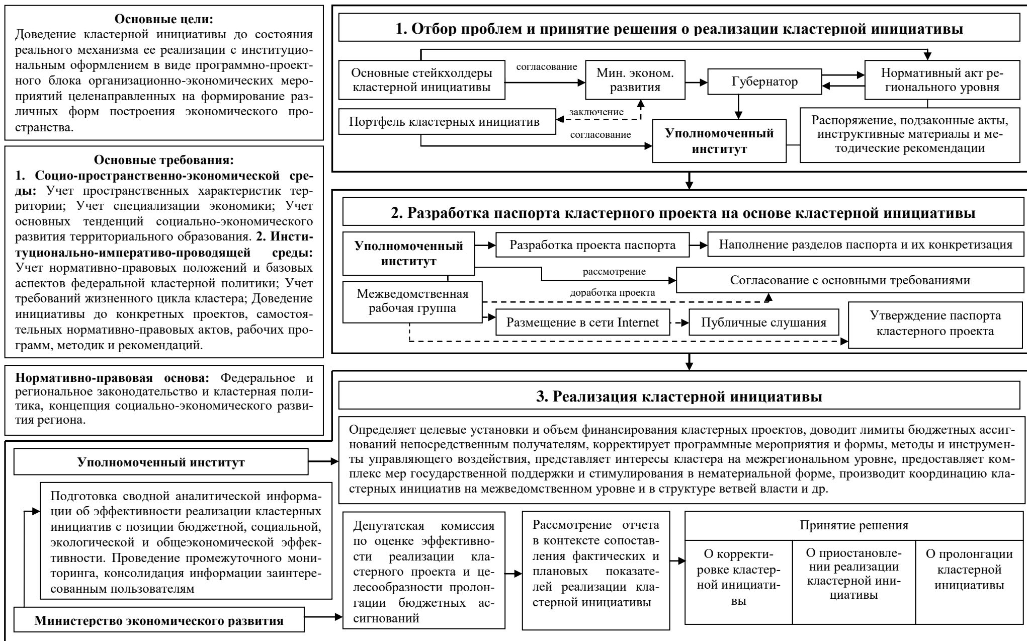
Рисунок 2 – Статико-динамические особенности процедурного блока реализации кластерной инициативы