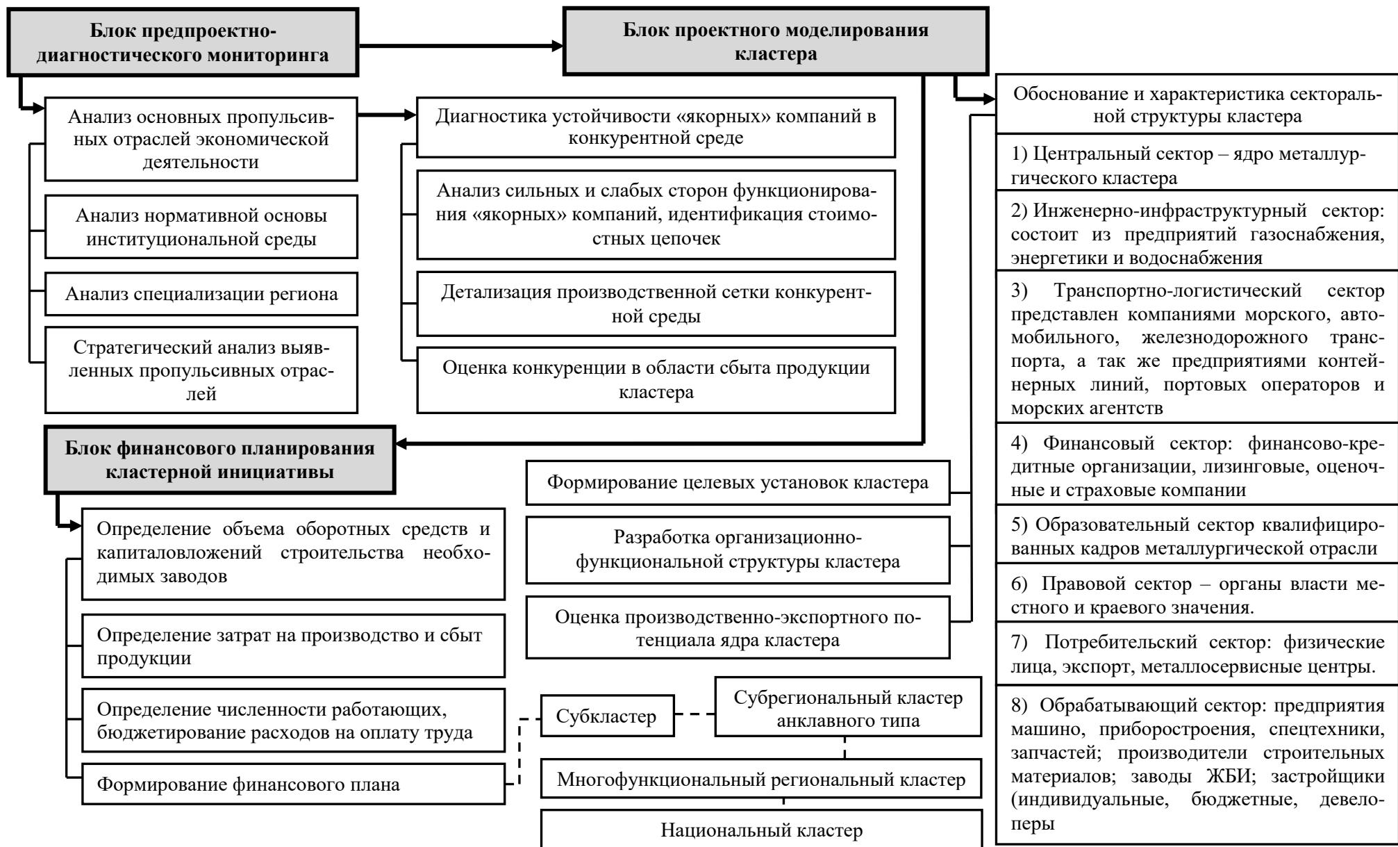
Рисунок 3 – Модельное видение процесса создания кластера на базе пропульсивной отрасли (разработано автором)