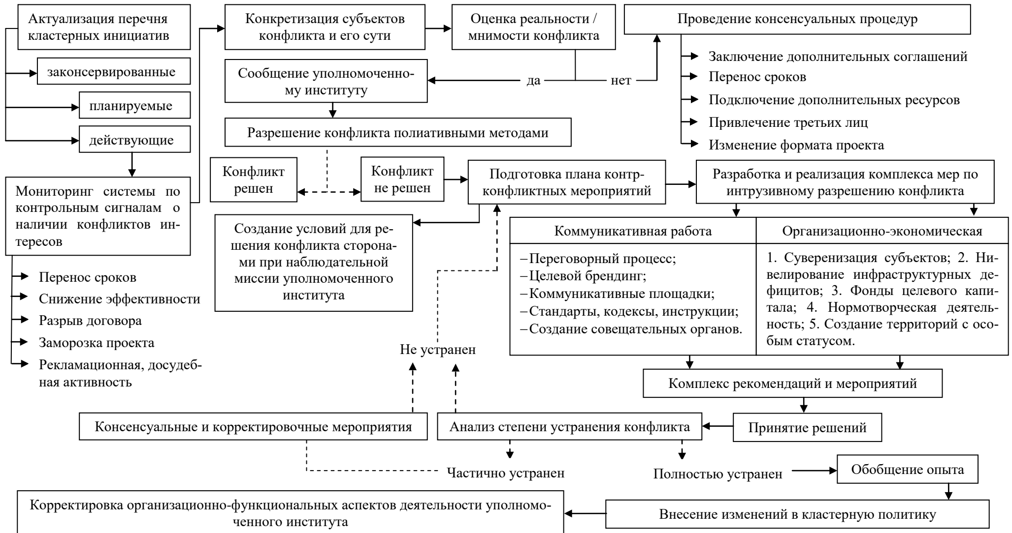
Рисунок 4 – Алгоритм совершенствования целевых программ в системе нивелирования конфликтов интересов основных участников кластерной инициативы