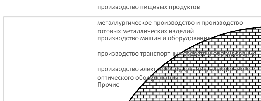
Рисунок 1 - Структура комплекса обрабатывающей промышленности Краснодарского края, 2013 г. 1

Оценка возможностей развития основных типов промышленных парков в экономике Краснодарского края. Традиционными отраслями специализации экономики Краснодарского края являются сельское хозяйство и пищевая промышленность, что задает один из векторов формирования промышленных парков. Вместе с тем, доля проектов промышленной направленности составляет в общем объеме инвестиционных проектов края 8%. Доля машиностроения в комплексе обрабатывающей промышленности Краснодарского края составляет всего 4.4%, что подрывает возможности преобразования территориальной промышленности (рис. 1).